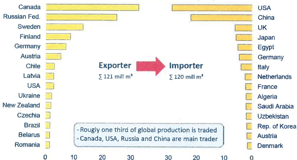
Main exporters and importers 2016 (in million m 3 , Top 15)

Sur le plan du commerce international, les volumes échangés sont en forte hausse, proches de 120 millions de m 3 .